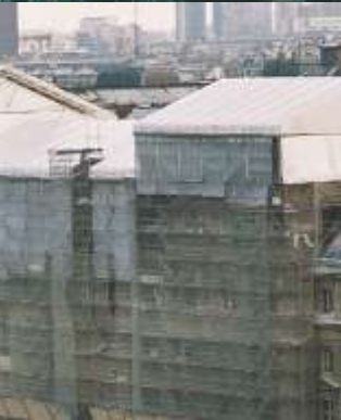
Layher keder çatı