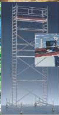
Layher hareketli İskele

Wilhelm Layher GmbH & Co. KG İskele - Mobil İskele - Merdiven Ochsenbacher Strasse 56 D-74363 Güglingen-Eibensbach Posta kutusu 40 D-74361 Güglingen-Eibensbach Tel. +49 (0) 71 35 70-0 Faks +49 (0) 71 35 70-2 65 export@layher.com www.layher.com